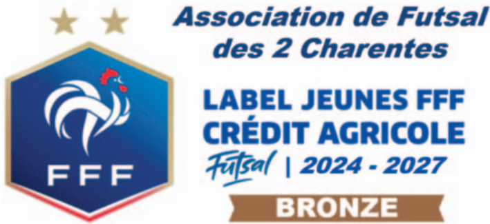
Label FFF Futsal Jeunes

Au-delà de la reconnaissance, c'est avant tout une feuille de route qui nous est donnée pour les 3 années à venir. Ces labels ne sont en rien une finalité mais un guide pour nous permettre de poursuivre notre structuration sportive.