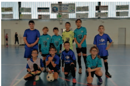
Nos U11 en coupe départementale

Chez nos jeunes, nous avons le plaisir de reconduire notre école de futsal tous les lundis de 18h à 19h15. Cette saison ce ne sont pas moins de 22 enfants qui suivent régulièrement des séances futsal chez