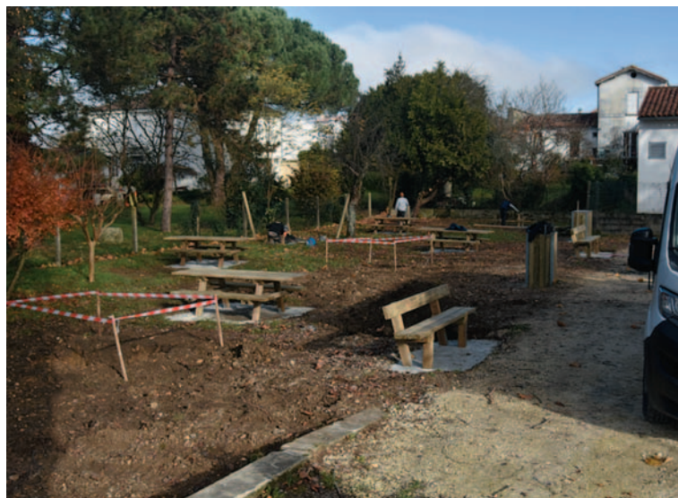
Les membres du Sas en cours de travaux d'installation

Cet aire de pique-nique et d'espace fraîcheur sera ouvert à tous les administrés et visiteurs de notre commune.