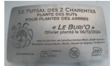
Plaque Le Buri'O

et Engagés". Nos dirigeants, en présence du District de Football de la Charente Maritime et de Football Ecologie France, ont officiellement inauguré le Buri'O. Cet Olivier est le fruit de la collaboration de nos joueurs seniors et de nos partenaires. Lorsque les premiers sont performants, les seconds financent un arbre. Et ceci dans le but de contrebalancer les impacts sur l'environnement de notre association. Quand on sait que nos licenciés font 3 fois le tour de la terre sur l'année pour pratiquer le futsal... Il nous semble important d'agir pour les générations futures. Une inauguration couverte médiatiquement par France Bleu La Rochelle qui a mis en avant notre municipalité, notre association, et notre volonté commune d'œuvrer dans l'intérêt général. Et un projet reconduit pour cette nouvelle saison. Un Buri'O qui trouve sa place au cœur de notre commune tout proche de la mairie.