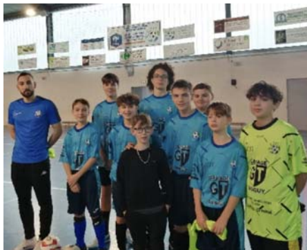
Nos U15 en coupe départementale

Preuve que le futsal plait, une quinzaine d'enfants de 14/15 ans ont rejoint notre club. C'est donc tous les mardis de 18h à 19h15 que cette nouvelle génération s'entraîne. Un groupe qui continue de s'étoffer au fil des mois. C'est donc un