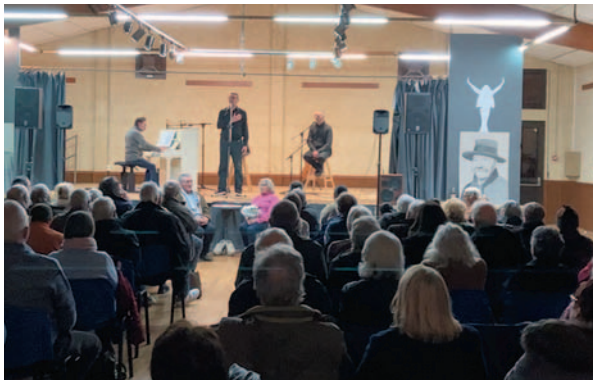
Le trio chantant le Vin Bian.