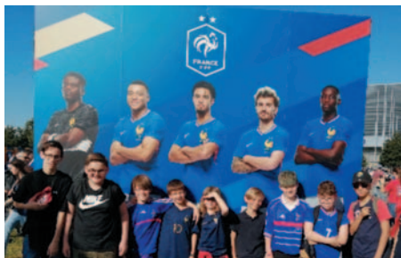
Nos jeunes au match France - Canada

Nous avons également reconduit nos cycles découverte Futsal auprès des clubs voisins pour leurs écoles de football. Ainsi nous éveillons au futsal près d'une centaine d'enfants supplémentaires de novembre à février. Partenariat qui nous apporte là aussi une vingtaine de licences supplémentaires chez les enfants de 6 à 12 ans.