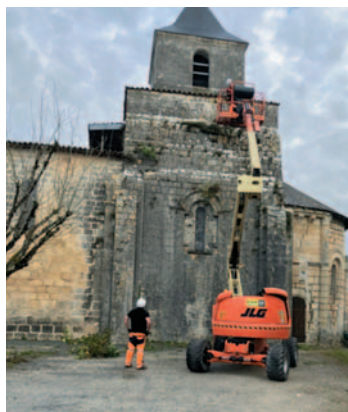
Damien assurant la sécurité au pied de la nacelle

Au fil du temps les murs de l'église se sont recouverts d'une végétation disgracieuse. Le 7 novembre les agents techniques communaux ont procédé à l'enlèvement de l'ensemble de cette végétation. L'intervention s'est déroulée en sécurité à l'aide d'une nacelle.