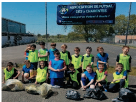
World Clean Up Day de nos jeunes

Depuis 2 ans maintenant nous nous attachons à développer notre engagement citoyen au cœur de notre commune. Nous avons conscience que notre petite association n'a que peu de poids dans l'économie locale, et pourtant nous mettons un point d'honneur à solliciter aussi souvent que possible nos commerçants et artisans locaux. Nous voulons avant tout créer un véritable réseau de partenaires plutôt que de simples sponsors. De ce côté-là nous avons pour projet de réaliser un challenge inter-entreprise courant mai suivi d'un afterwork pour permettre aux entreprises de la commune et des alentours de se