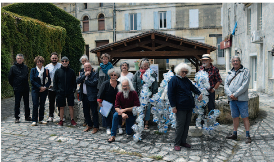
Inauguration de l'exposition en présence des artistes, du Maire et d'administrés.

La deuxième œuvre "La Vague" nous rappelle que la nature nous renvoie les déchets qu'on lui fait subir.