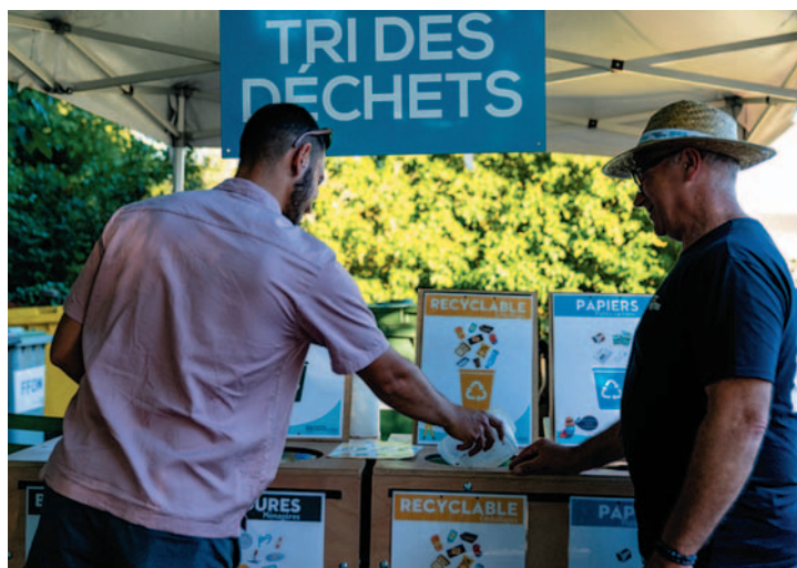
Une organisation eco-responsible avec un tri des déchets très efficace