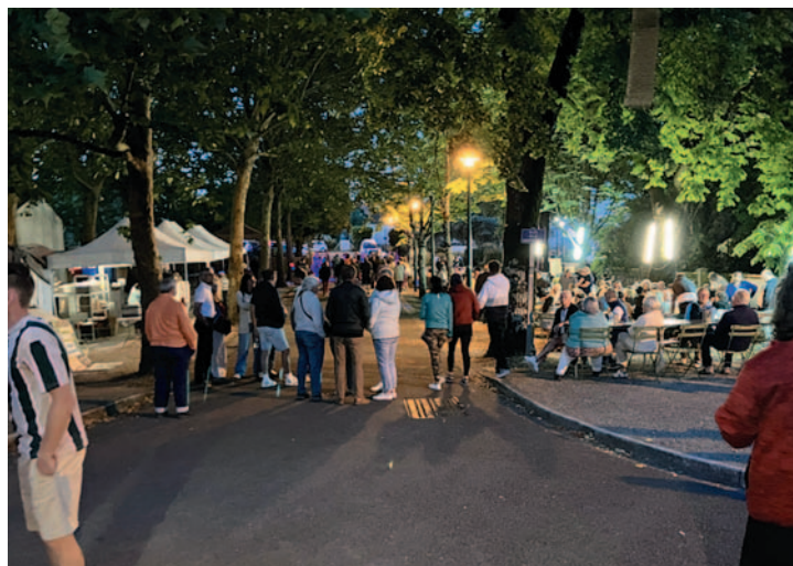
Le marché fermier