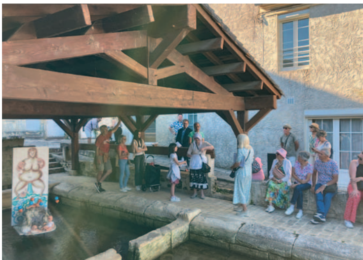
La lavandière dénonçant son forfait du vol des diamants

Après ces agapes, quelques 200 personnes ont assisté au spectacle du groupe "Aux petits rognons" sur la Place de l'Hôtel de Ville. Un grand merci aux animatrices de l'Agglomération, de la Chambre d'Agriculture 17 et aux bénévoles de la commune pour leur contribution à la réussite de la première animation de ce type sur notre commune.