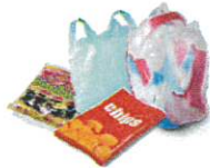
Emballages en plastiques souples