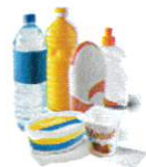
Emballages en plastiques rigides